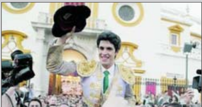
Salida en hombros por la Puerta del Príncipe el 23 de abril.