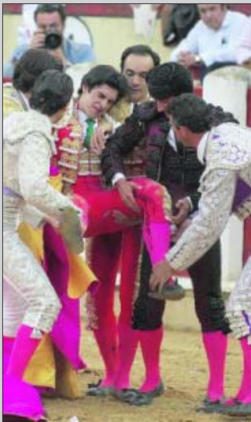
Percance en la Feria de Valladolid de este año.