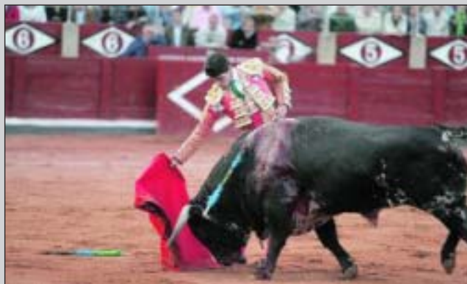
Presentación en Salamanca el 15 de septiembre de 2006.