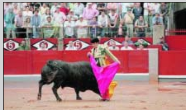
Toreando de capote en medio del diluvio en la plaza de La Glorieta.

que ves hacer cosas que te gusta y que te pueden dar una idea de la línea a seguir, pero luego ya te forjas tu propia tauromaquia y los más grandes han forjado la suya.