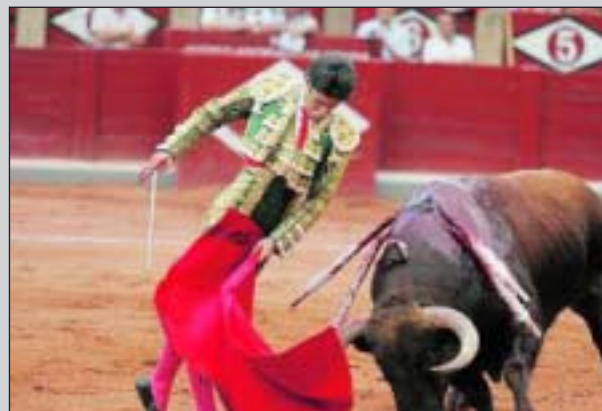
Luciéndose con la muleta en la pasada Feria de Salamanca.